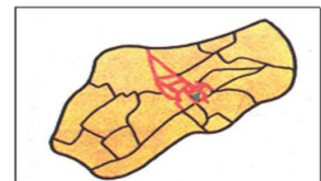
التصميم غير الهندسي