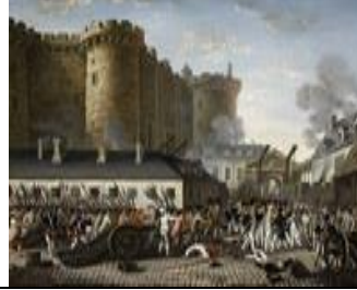
سقوط حصن الباستي