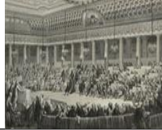
تأسيس الجمعية التأسيسية

السؤال الأول : رتب الأحداث التالية على الخط الزمني معتمدا تواريخ دقيقة (3 نقاط)