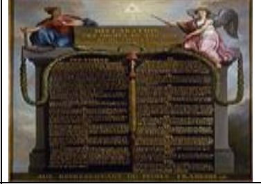
إعلان حقوق الإنسان و المواطن