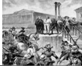
إعدام لويس السادس عشر