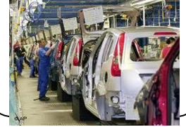
ورشة لصناعة السيارات