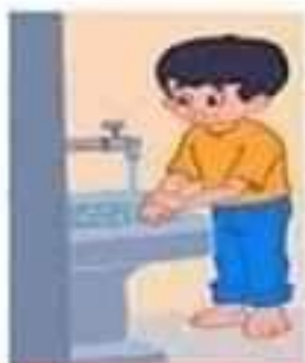
التيبة و غسل الكفين

المستطبة ثلاث حررات بأن يدخل الماء فمن فمها ثم يستطبة كففي الأيمن ثم الأيسر ثم يدخل فمها ثم يخرجها.