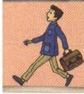
أذهب إلى المدرسة