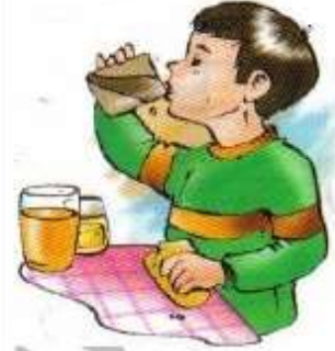
أتناول فطور الصباح

التَّعْلِيمَةُ : أَرْتَبُ أَعْمَالَ مُرَادٍ لِأَكُونَ نَصًّا قَصِيرًا : قَالَ مُرَادُ :