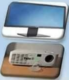
الشاشة écran أو جهاز العرض ( data show بالانجليزية )