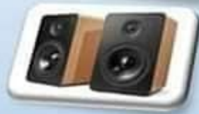
مكبر الصوت Haut-parleur