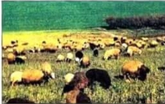
مشهد ريفي مفتوح من الشمال التونسي