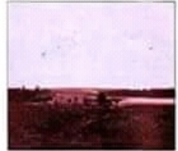
مركز ريبي مع حقل الزيتون القديم

تعتبر المساكن عنصراً من المشهد الريفي لأنها جزء لا يتجزأ منه، وهي تنقسم إلى قسمين: مساكن متفرقة في شكل مساكن فردية، ومساكن متجمعة في شكل مساكن مترابطة. كما يتكون السكن الريفي من مسكن الفلاح والإسطبلات والمستودعات والورشات والمخازن المرتبطة بالنشاط الفلاحي.