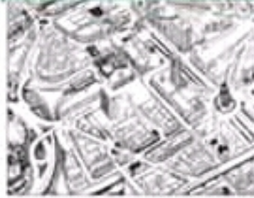
تصميم أجزاء من مدينة تونس

تتكوّن مدينة تونس من قسمين أساسيين وهما المدينة العتيقة والمدينة الحديثة لكلّ منهما خصائص عمرانيّة مختلفة.