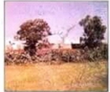
مركز ريبي مع حقل الزيتون القديم