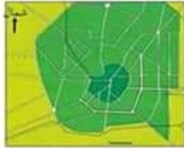
تصميم مدينة ميلانو