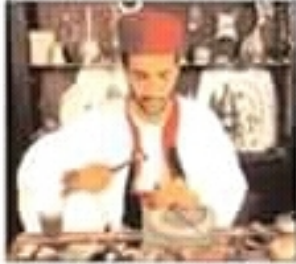
التقش على النحاس

الدروس – الجغرافيا – السنة الخامسة أساسي