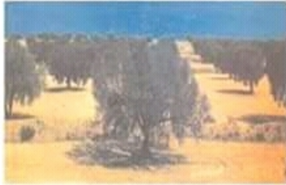
مشهد غراسة الزيتون قرب صلفين