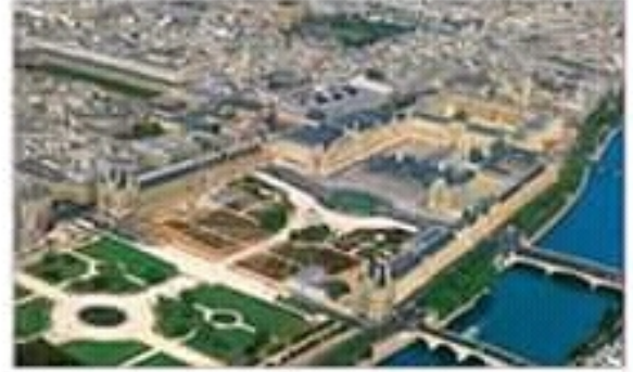
صورة لمتحف اللوفر بباريس

وظيفة ثقافية : تتركز بمدينة باريس العديد من المنشآت الثقافية على غرار المسارح والمعارض والفضاءات وذلك ما يجعل من هذه المدينة مركزا ثقافيا عالميا و من أهم هذه المنشآت نذكر متحف اللوفر.