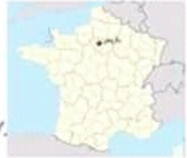
1- موقع مدينة باريس :