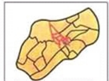
التصميم غير الهندسي