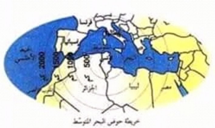
خريطة حوض البحر المتوسط

تقع البلاد التونسية شمال القارة الإفريقية يحدها البحر الأبيض المتوسط شرقا وشمالا وتحدها الجزائر غربا أما جنوبا فتحدها ليبيا والجزائر معا.