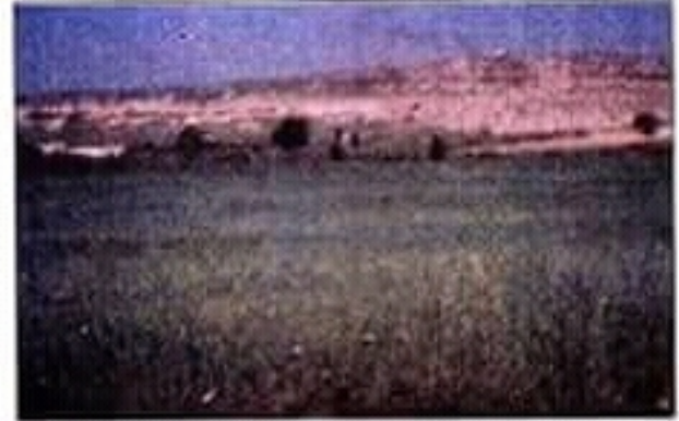
مشهد ريفي من الشمال التونسي

يعتبر المشهد الريفي صورة وقتية لمجال هبأه الإنسان لتعاطي الفلاحة. وهو يتغير حسب الفصول. ففي فصل الربيع يغلب عليه اللون الأخضر نتيجة كثرة الأعشاب والزراعات، في حين يصفر في فصل الصيف منبأ بحلول فصل الحصاد، أما خريفا وشتاء فيكون المشهد الريفي خاليا من النباتات وتكون الأشجار عارية من الأوراق.