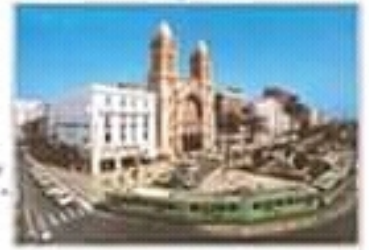
تونس شارع الحبيب بورقيبة