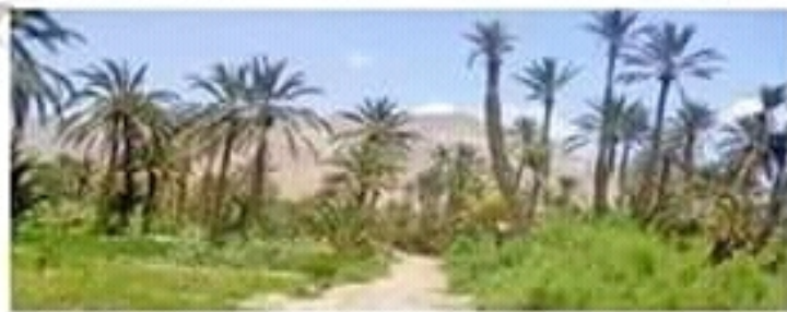
واحة القطار- قفصة