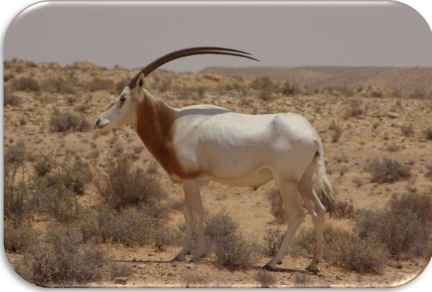
مها أبو حراب