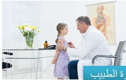
✓ زيارة الطبيب