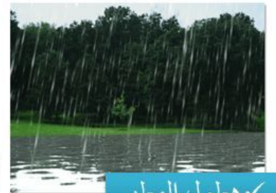
✓ هطول المطر