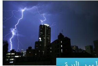
✓ ظهور البرق