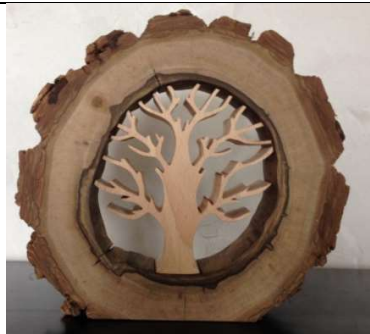
Sculpture en bois.

Matières utilisées : les matières dures, telle que: