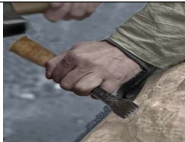
Tailler au moyen du ciseau