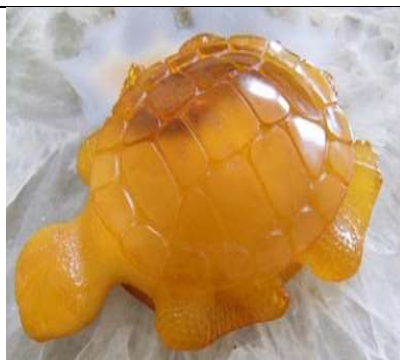
Sculpture en ambre