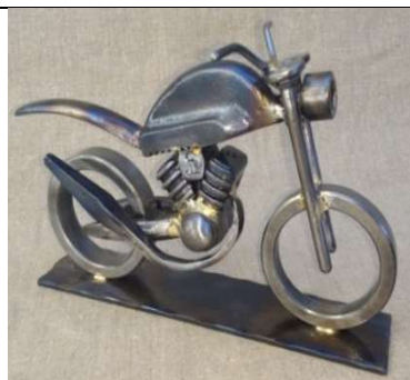
Sculpture en fer