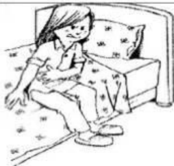
Image3: Que se passe t-il la nuit ?