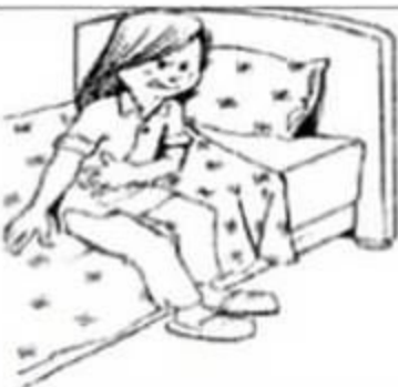
Image3:Que se passe t-il la nuit ?