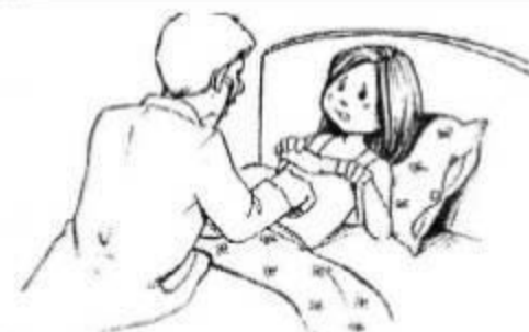
Image3: Que fait sa mère ?