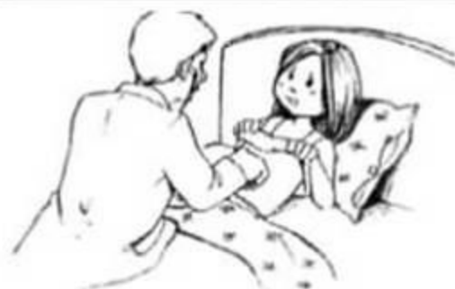
Image3:Que fait sa mère ?