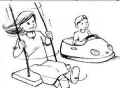
Image1 : Que fait Amélie ? que fait Julien ?

Regarde bien les images et écrit quelques phrases pour raconter ce va se passer.