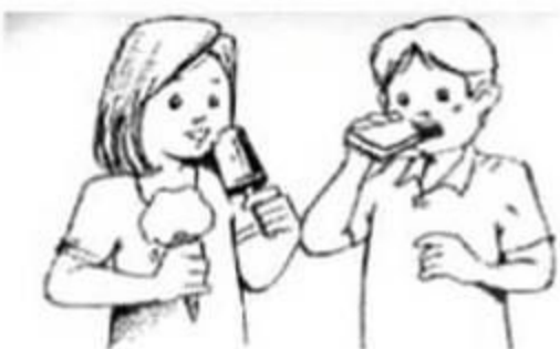
Image2:Les deux enfants ont faim que font ils ?