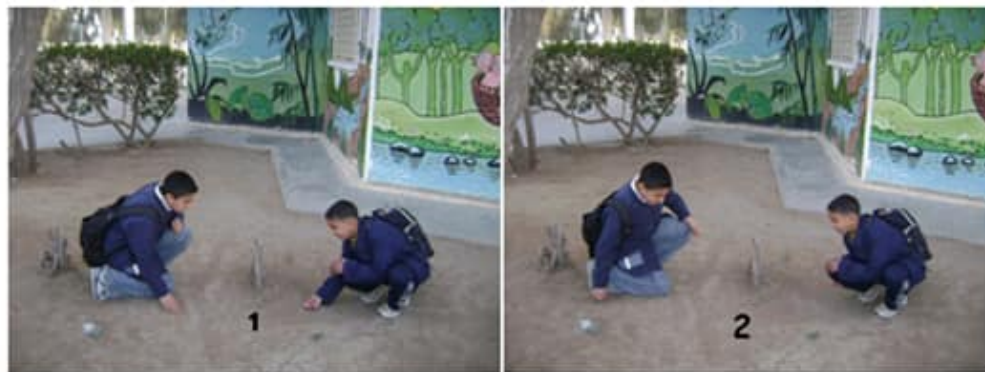
École 2 mars 1934 - Kairouan

bredouiller - décider - interrompre - s'exclamer - demander - ajouter - Affirmer - Conseiller - Crier - dire - interroger - répondre - promettre - questionner